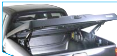
02 Heck geöffnet