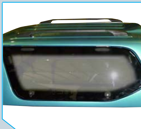
01 mit aufklappbaren Fenstern